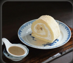
味噌と大豆のロールケーキ ごまソース付き