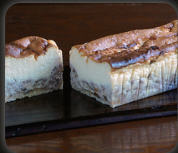
チーズとクルミのケーキ