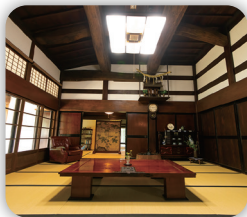
ケヤキの梁と鴨居が豪快な広間