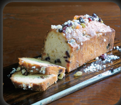
酒かすとドライフルーツの パウンドケーキ