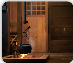
歴史が残る生活空間