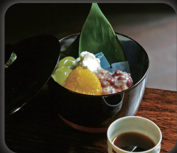
発酵あんこの白玉あんみつ