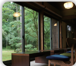
客席から望む苔庭