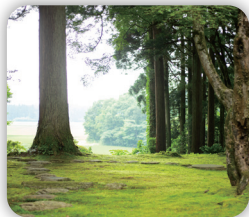
枯山水の借景庭園